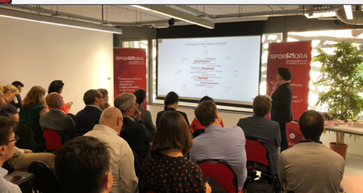
Workshop « RSE une opportunité pour le sport », le 25/05/2018