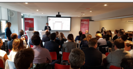
2 ème Observatoire du naming, le 10/10/18