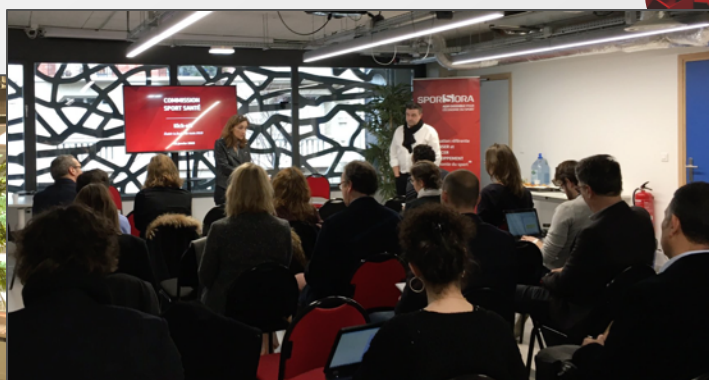
Commission Sport Santé, le 25/01/2019