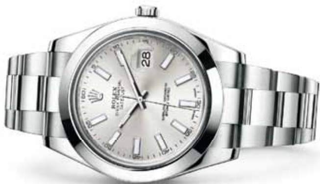
OYSTER PERPETUAL DATEJUST II